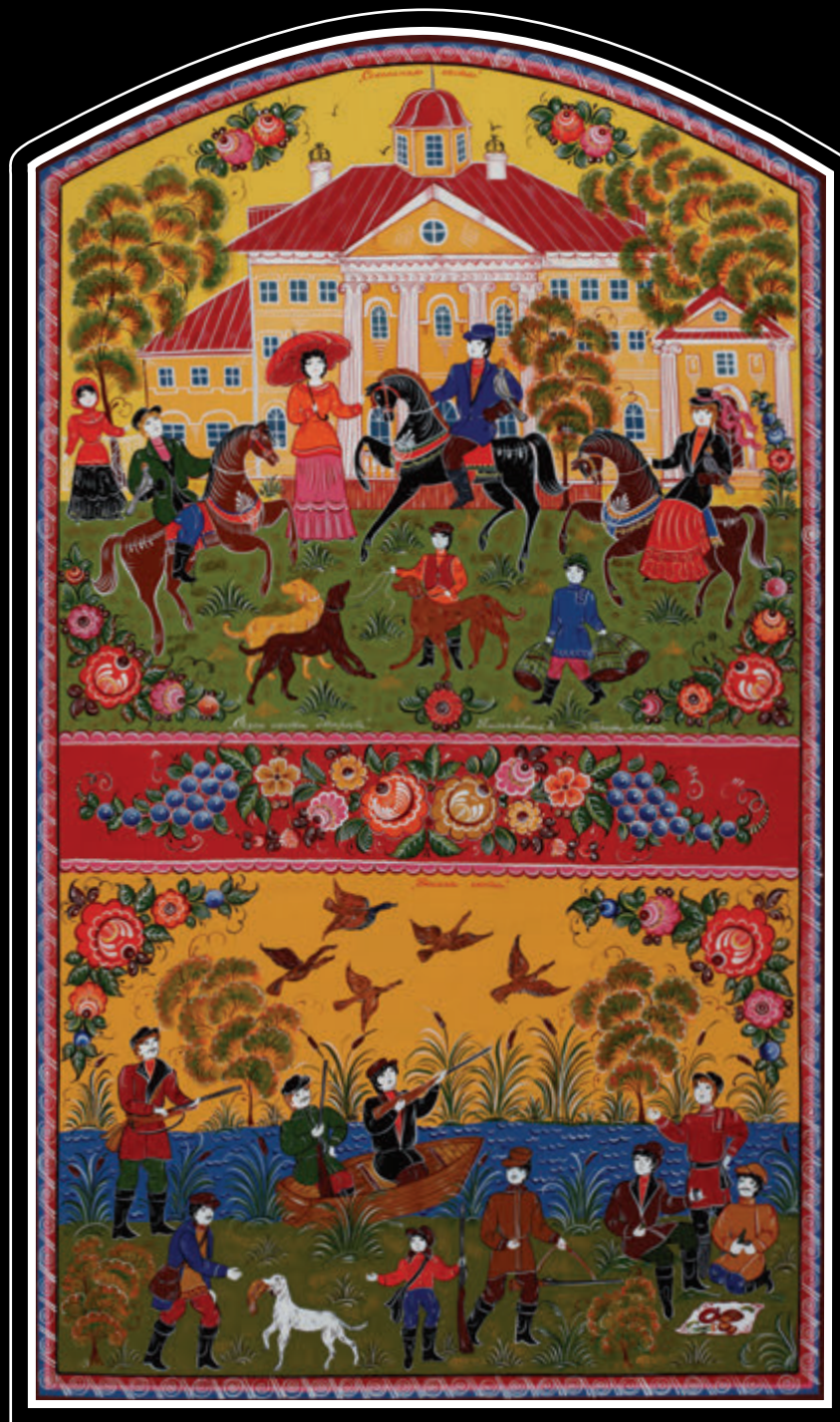
ООО «Фабрика Городецкая роспись» (Нижегородская область, город Городец)