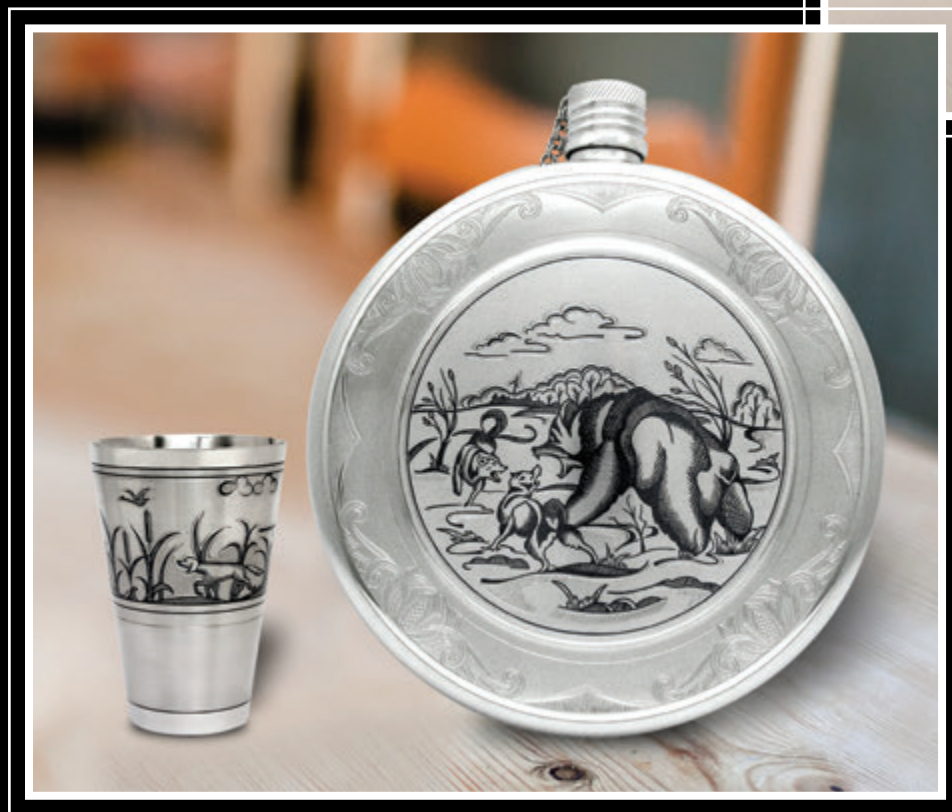
ЗАО «Великоустюгский завод «Северная чернь» (серебро 925) (Вологодская область, город Великий Устюг)