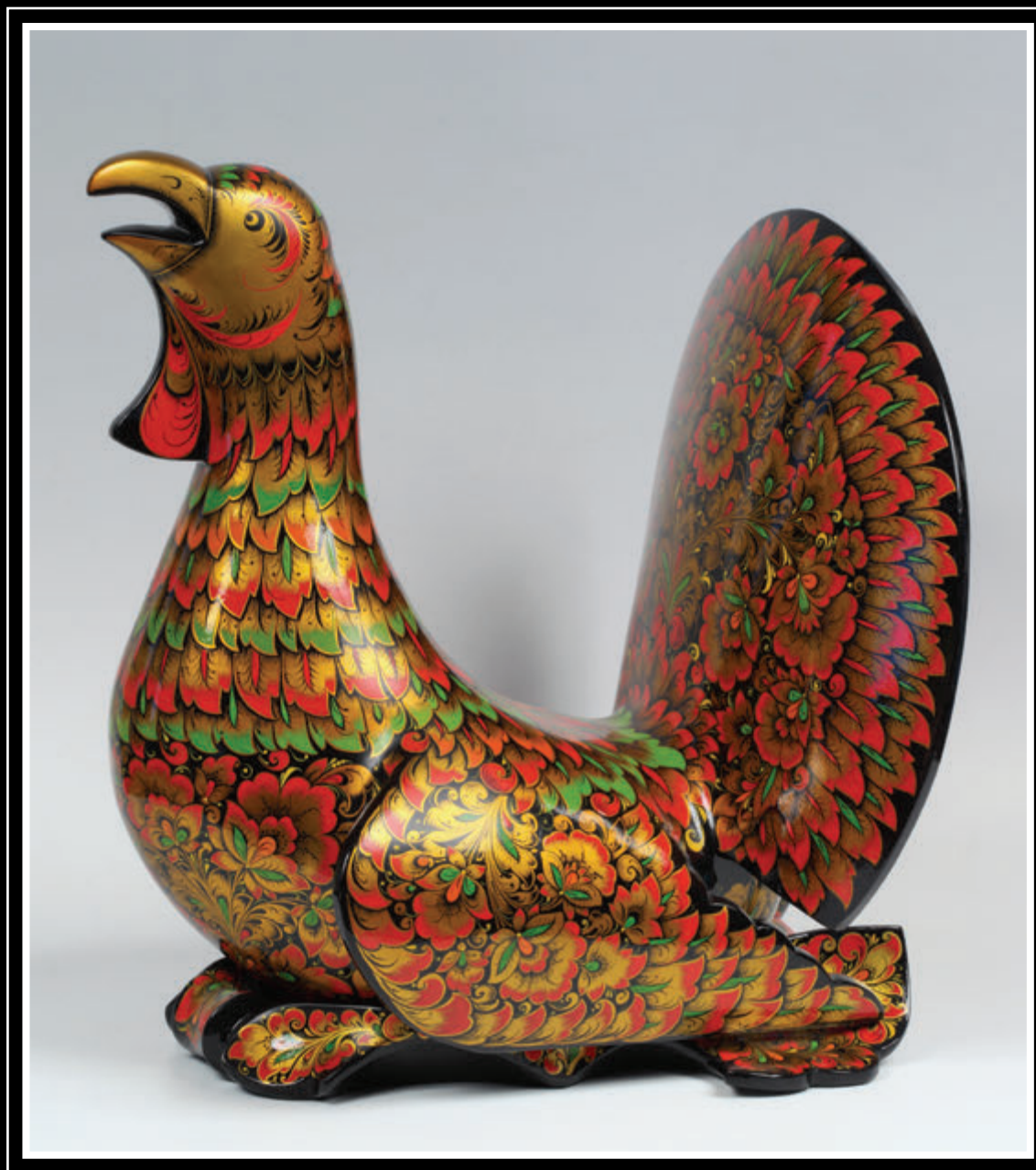
Ордена «Знак Почёта» АО «Хохломская роспись» (Нижегородская область, город Семёнов)