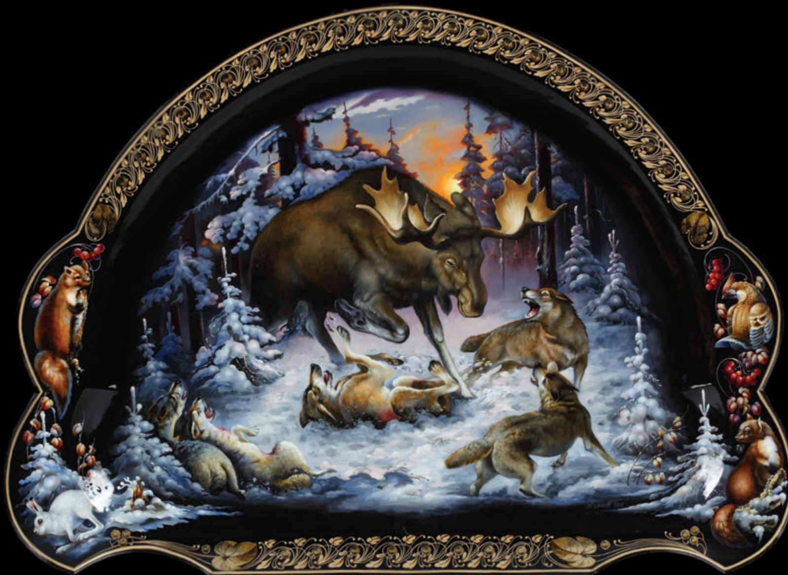
ООО «Жостовская фабрика декоративной росписи» (Московская область, Мытищинский район, деревня Жостово)