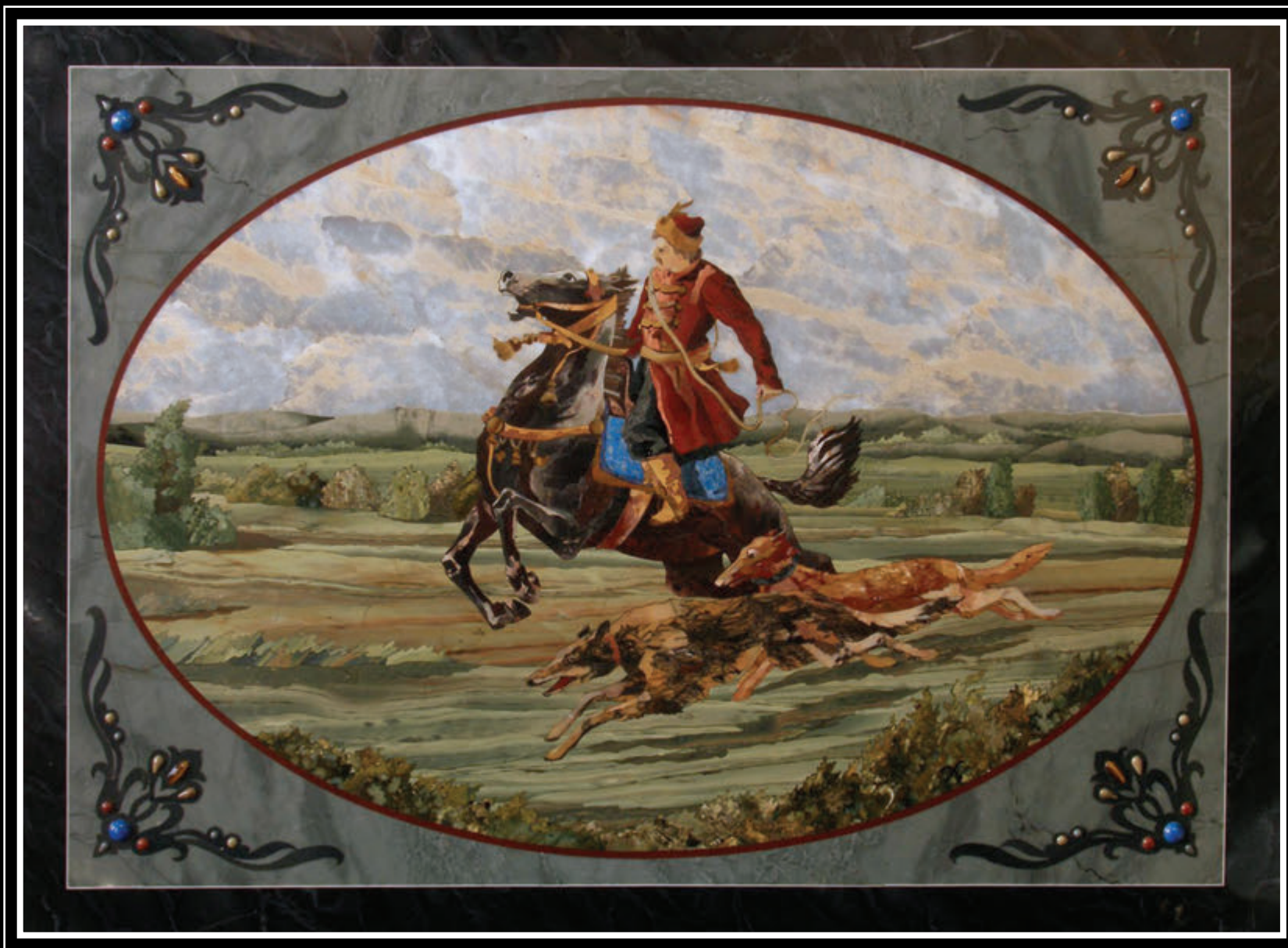
ООО УЎТТ НХТ «Артель» (Республика Башқортостан, город Уфа)