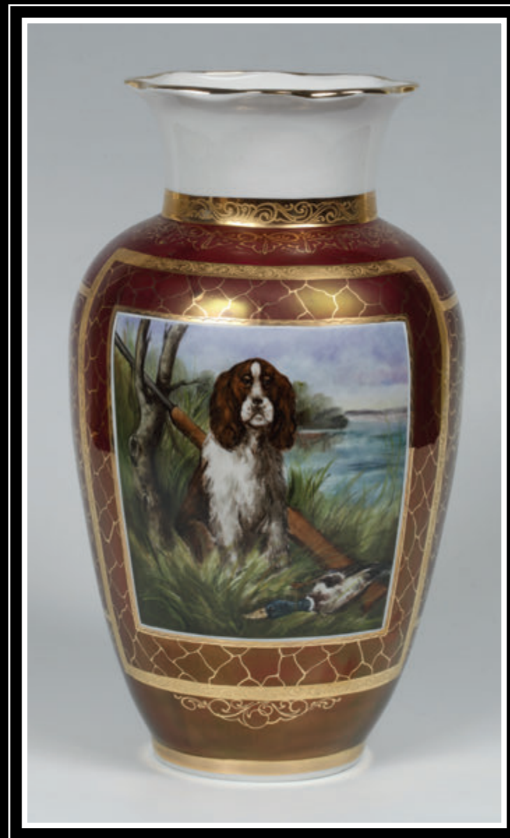
ЗАО «Кисловодский фарфор «Феникс» (Ставропольский край, город Кисловодск)