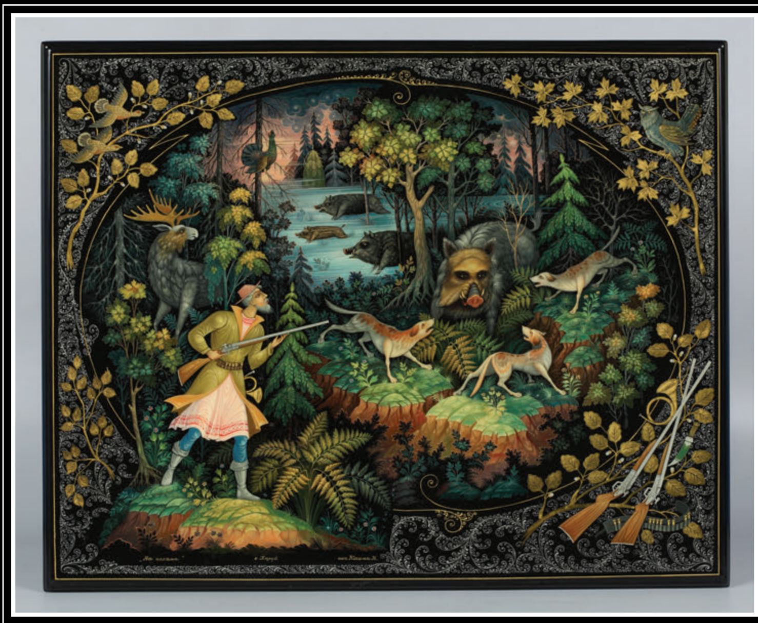
ООО «Холуйская художественная фабрика лаковой миниатюры» (Ивановская область, Южский район, посёлок Холуй)