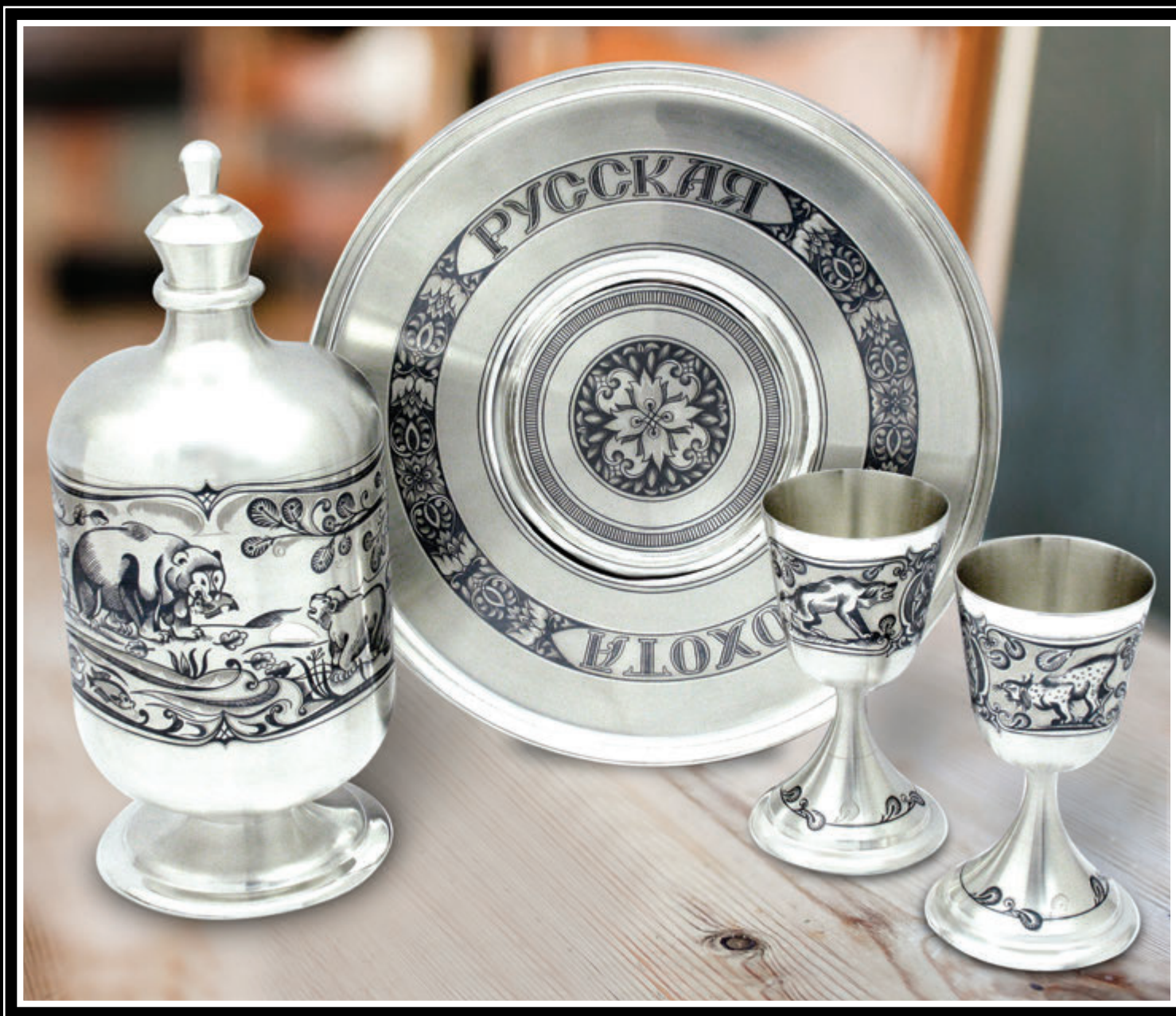
ЗАО «Великоустюгский завод «Северная чернь» (серебро 925) (Вологодская область, город Великий Устюг)