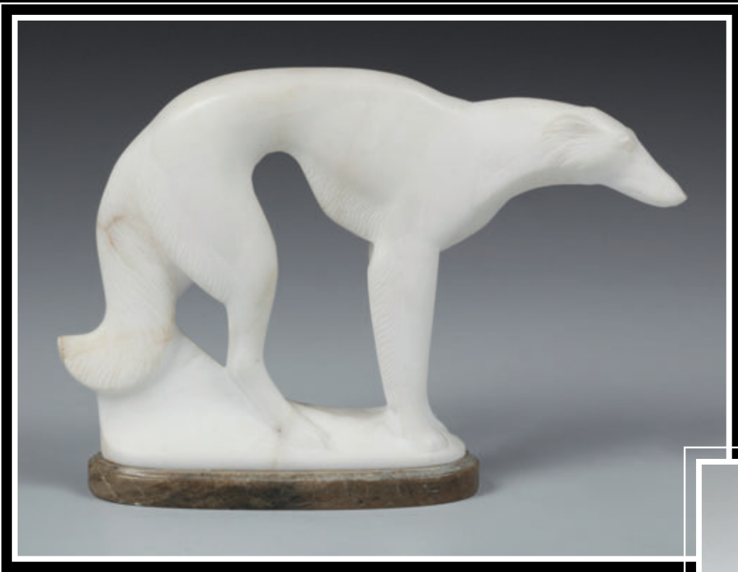
Уральский камнерез (Пермский край, село Красный Ясыл)