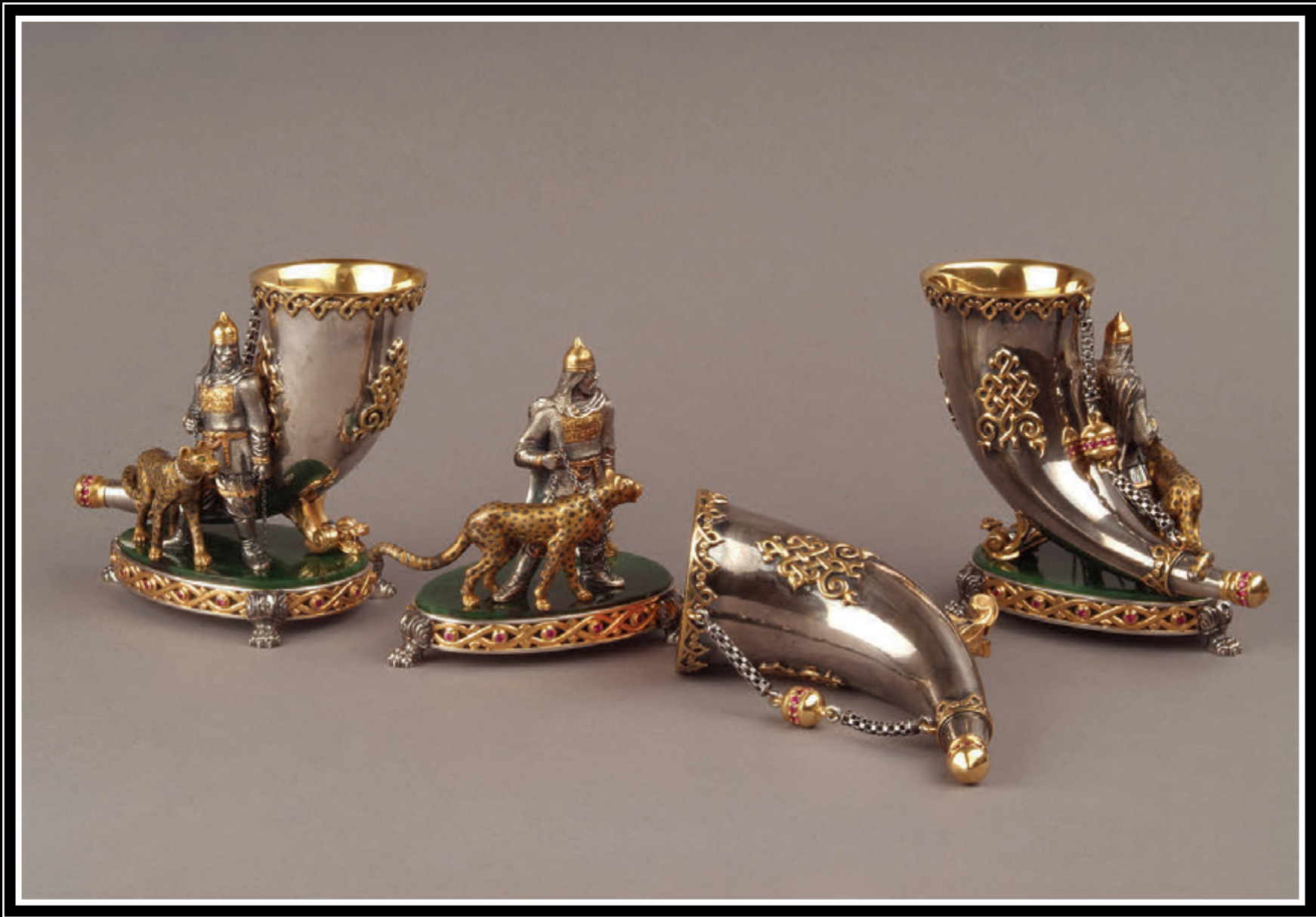
ООО «Галерея авторского оружия «Русские палаты» (город Москва)