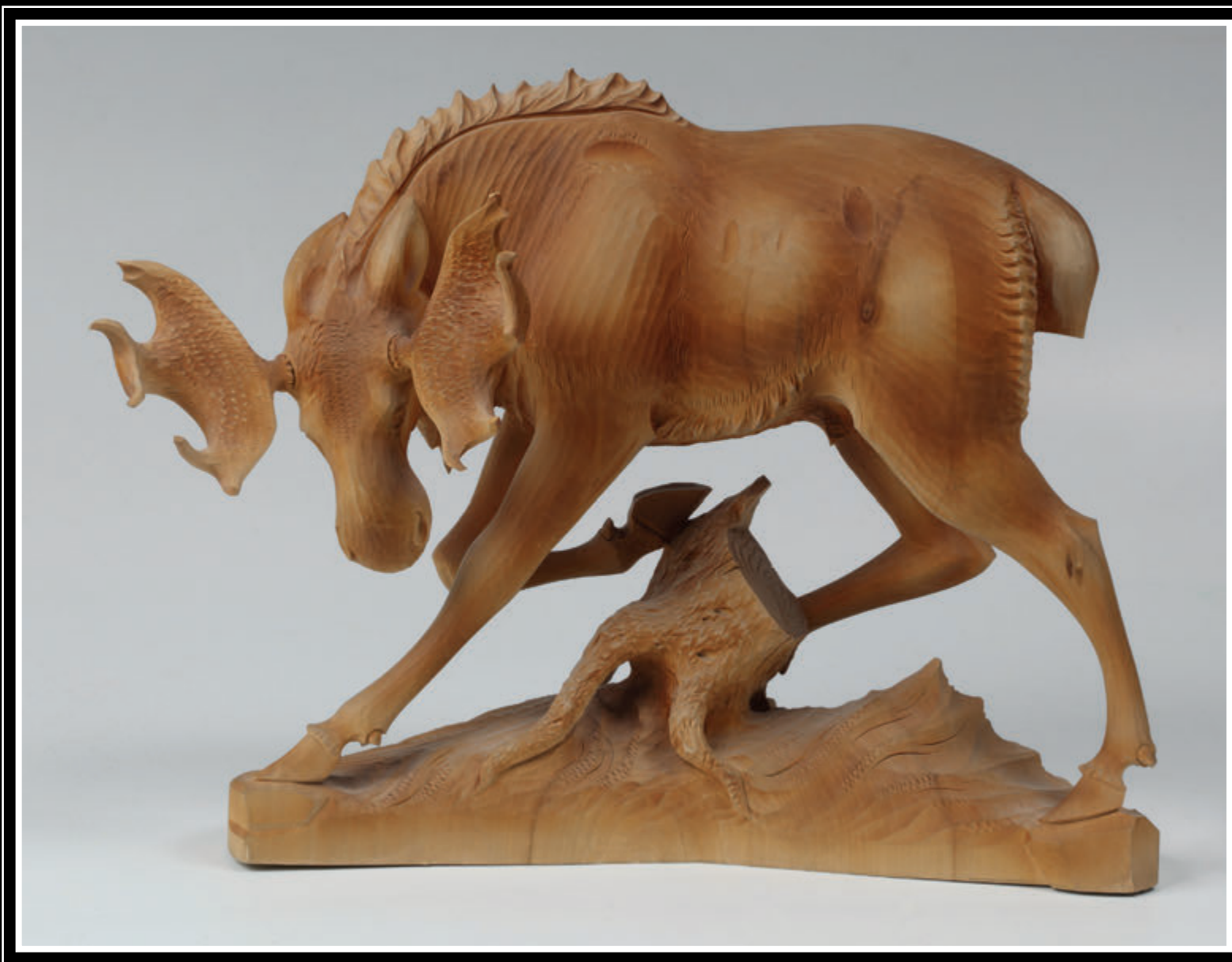
ЗАО «Богородская фабрика художественной резьбы по дереву» (Московская область, Сергиево-Посадский район, поселок Богородское)