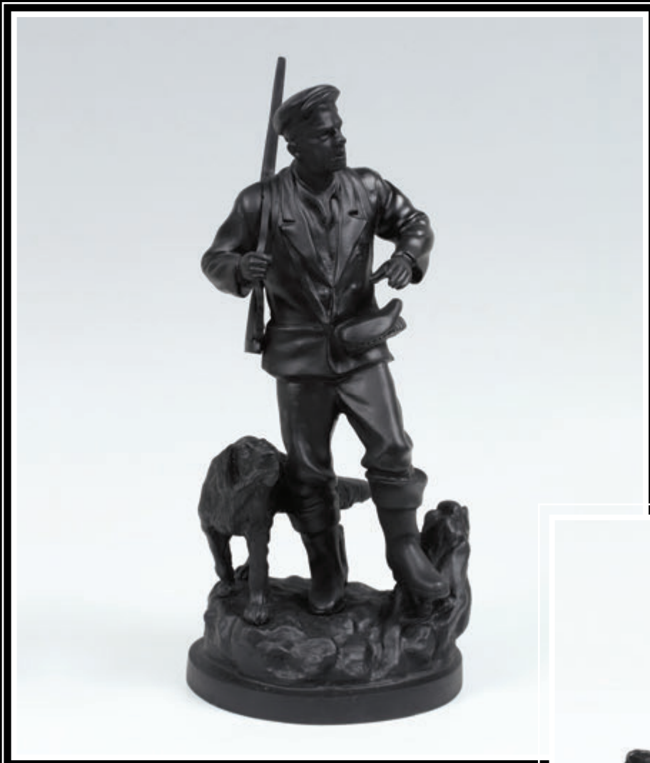
Каслинское литьё (Челябинская область, город Касли)