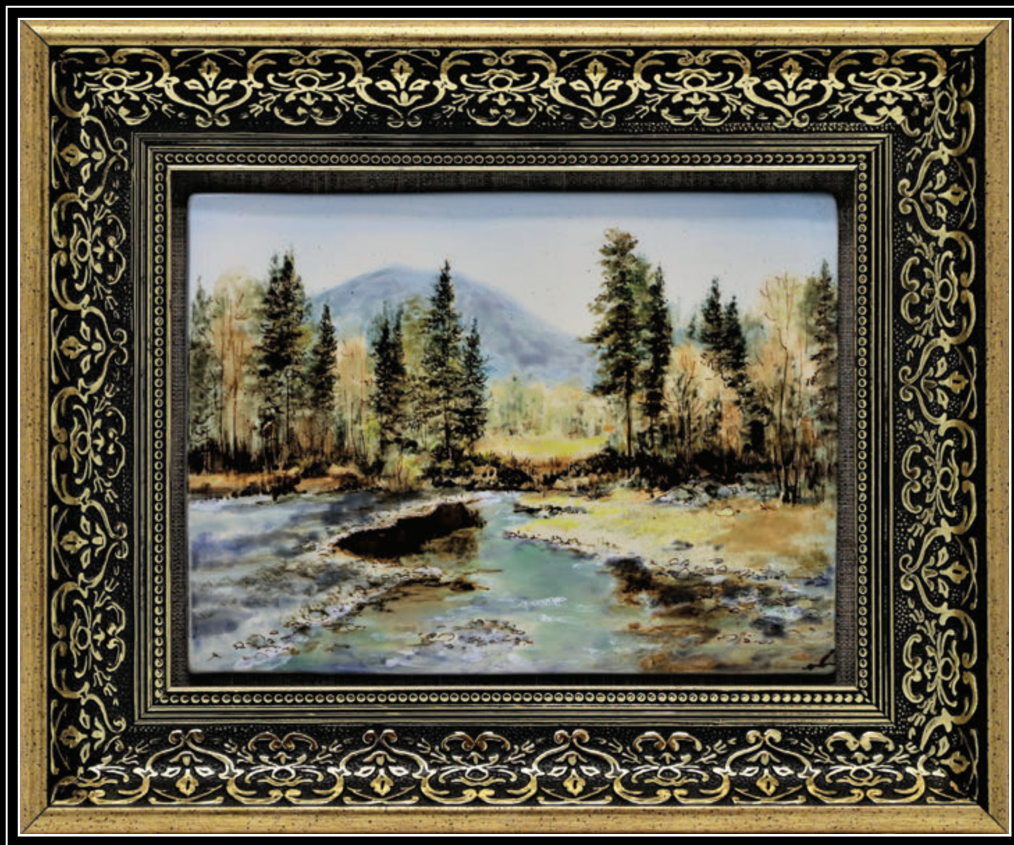
ООО «Шурина Гора, ҚО, АТД» (Алтайский край, город Барнаул)