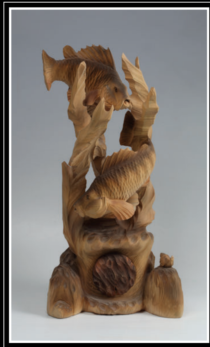
ЗАО «Богородская фабрика художественной резьбы по дереву» (Московская область, Сергиево-Посадский район, поселок Богородское)