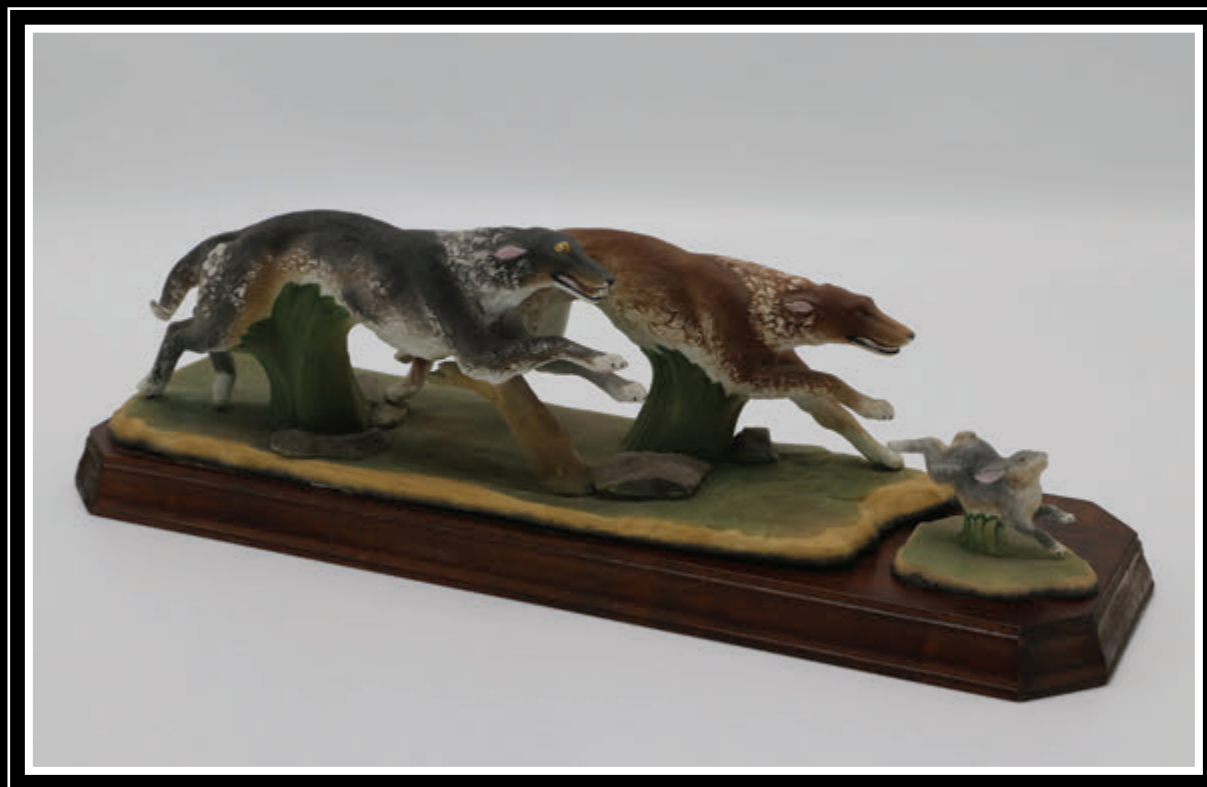
ЗАО «Кисловодский фарфор «Феникс» (Ставропольский край, город Кисловодск)