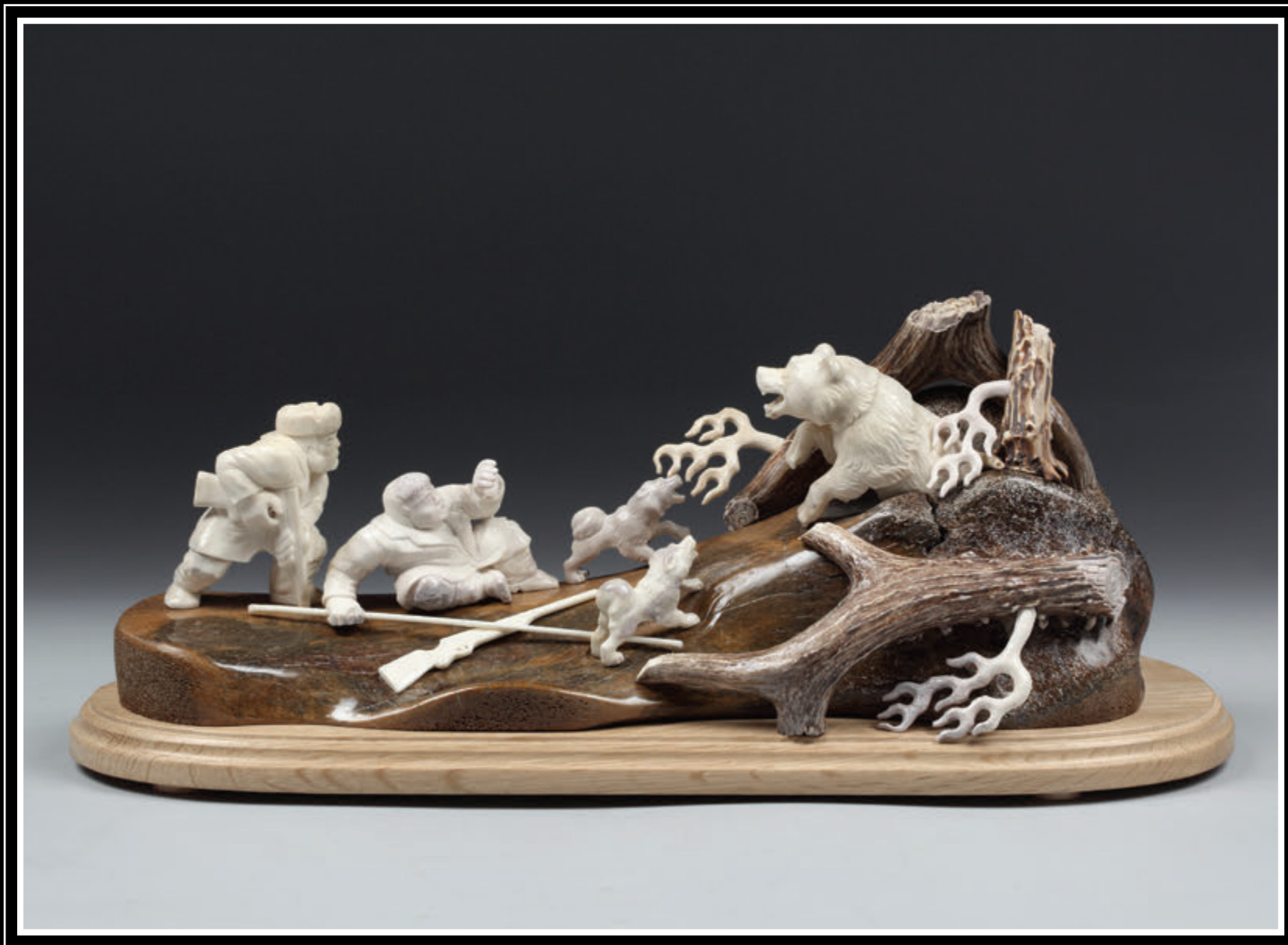
ООО «Тюбольская фабрика художественных косторезных изделий» (Тюменская область, город Тюбольск)