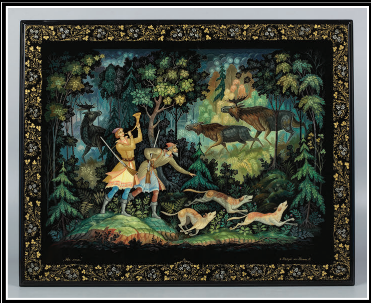
ООО «Холуйская художественная фабрика лаковой миниатюры» (Ивановская область, Южский район, поселок Холуй)