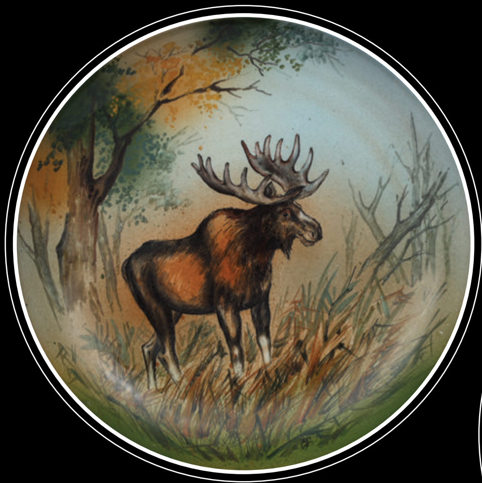
ПК «Завод «Псковский гончар» (город Псков)