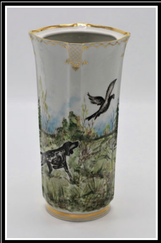
ООО «Фарфор Сысерти» (Свердловская область, город Сысерть)