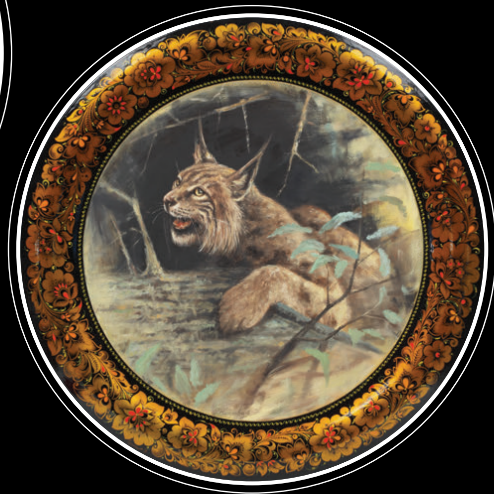
Ордена «Знак Почёта» АО «Хохломская роспись» (Нижегородская область, город Семёнов)