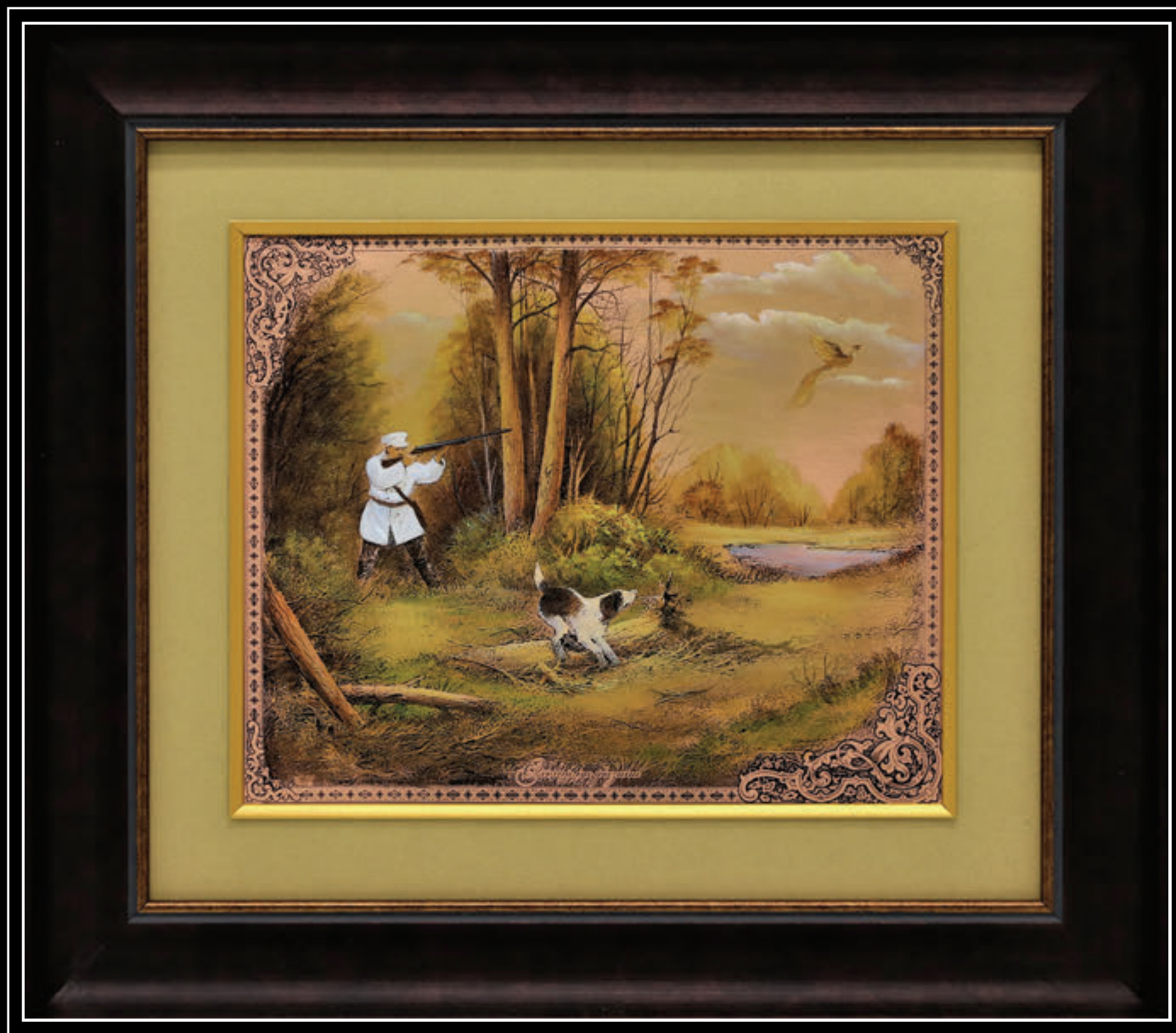
Художественная обработка металла