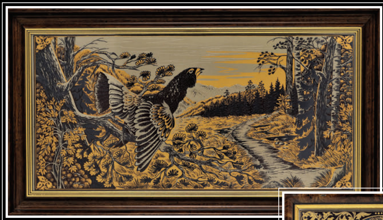
Златоустовская гравюра на стали (Челябинская область, город Златоуст)