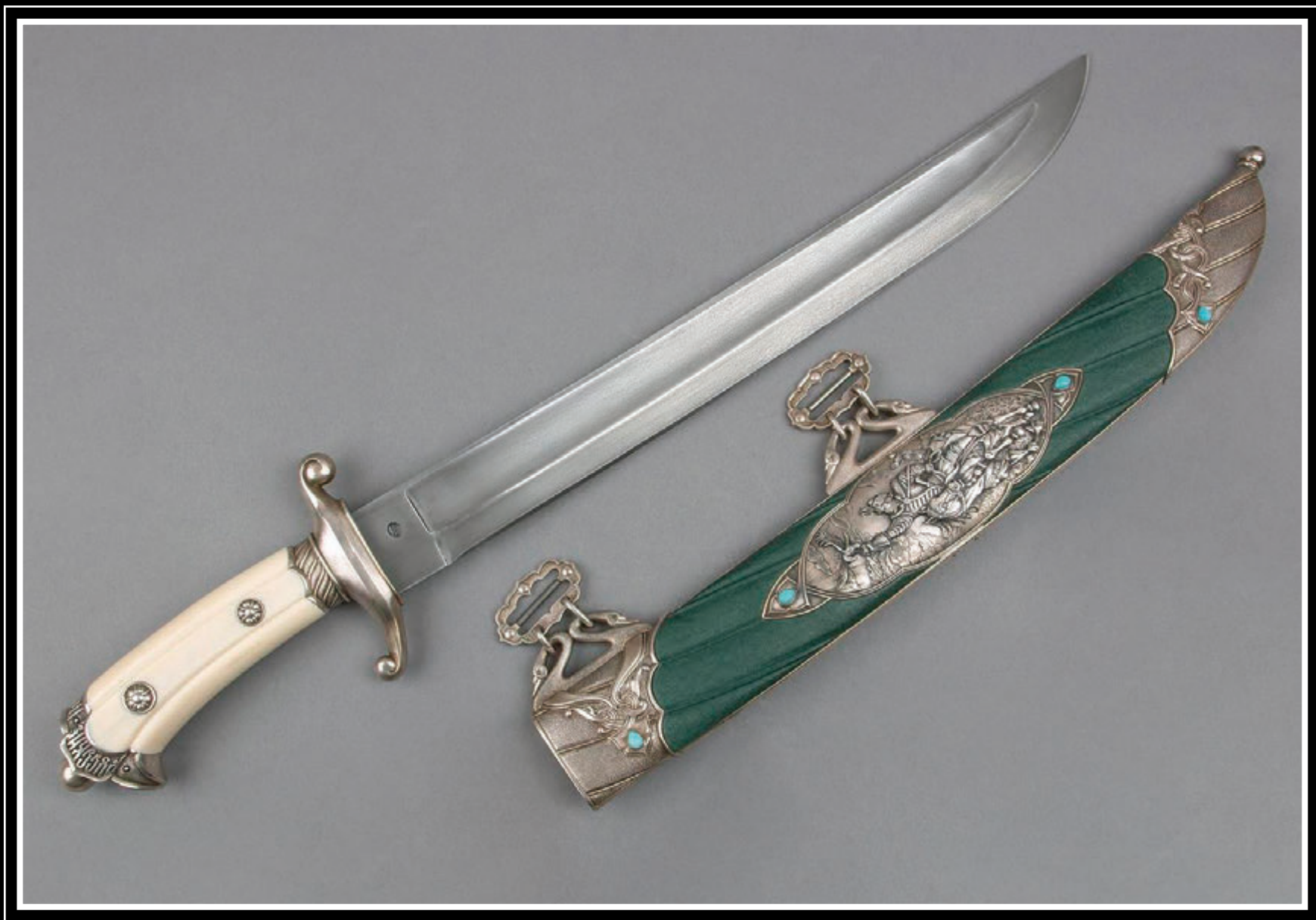
ООО «Галерея авторского оружия «Русские палаты» (город Москва)