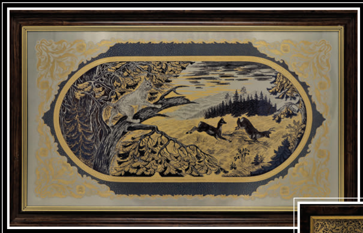
Златоустовская гравюра на стали (Челябинская область, город Златоуст)