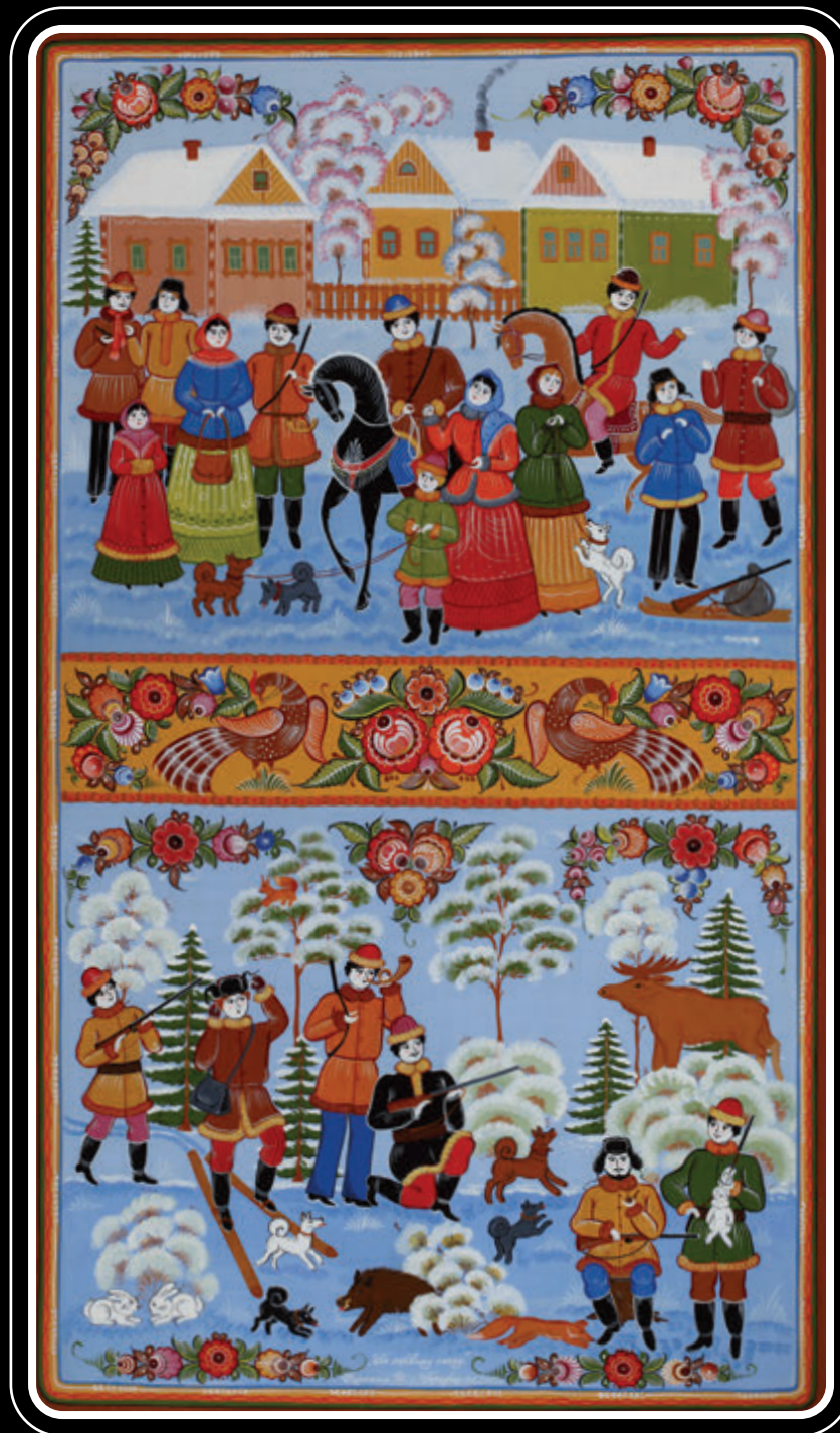
ООО «Фабрика Городецкая роспись» (Нижегородская область, город Городец)