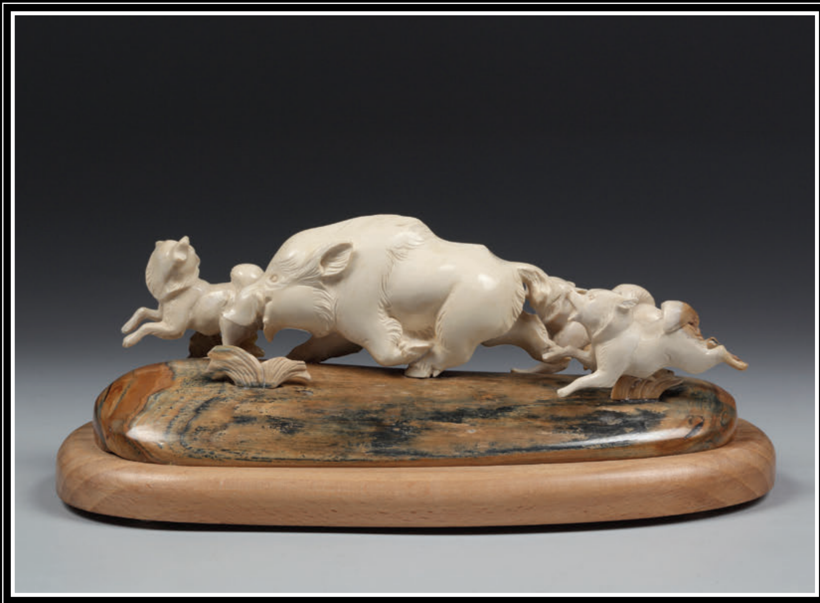
ООО «Тобольская фабрика художественных косторезных изделий» (Тюменская область, город Тобольск)