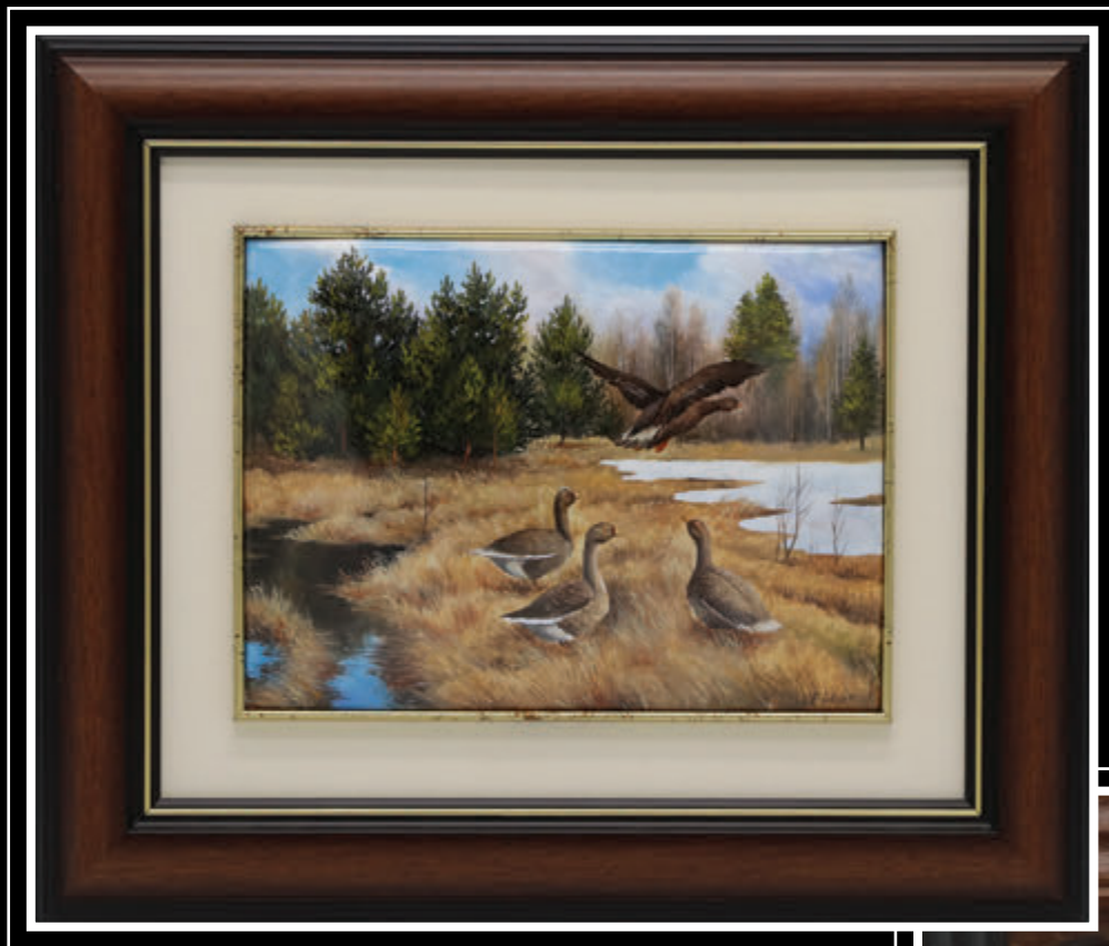
ЗАО «Фабрика «Ростовская финифть» (Ярославская область, город Ростов)