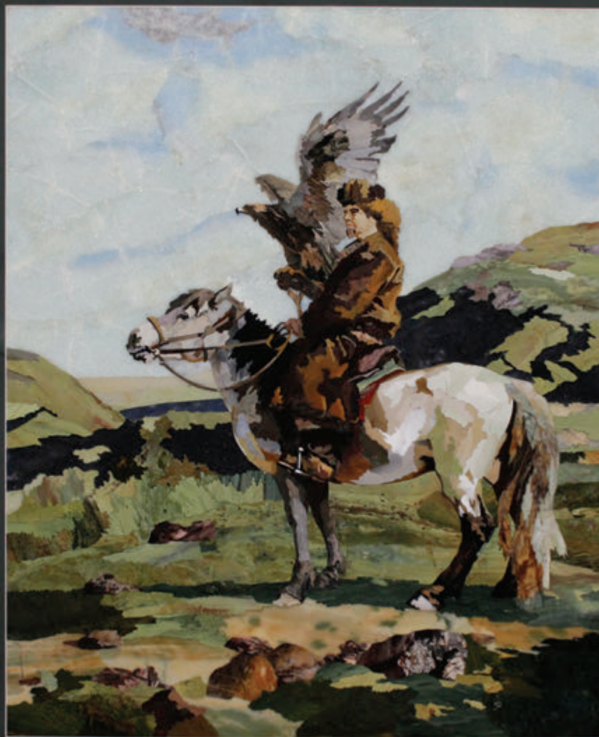
ООО УПТНХП «Артель» (Республика Башкортостан, город Уфа)