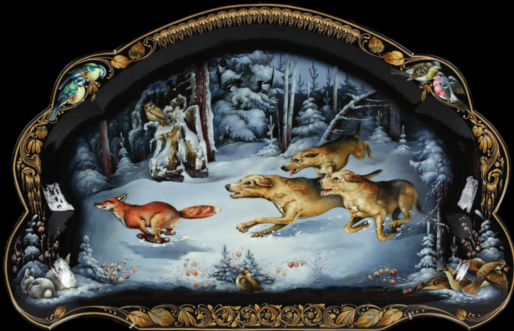
ООО «Жостовская фабрика декоративной росписи» (Московская область, Мытищинский район, деревня Жостово)