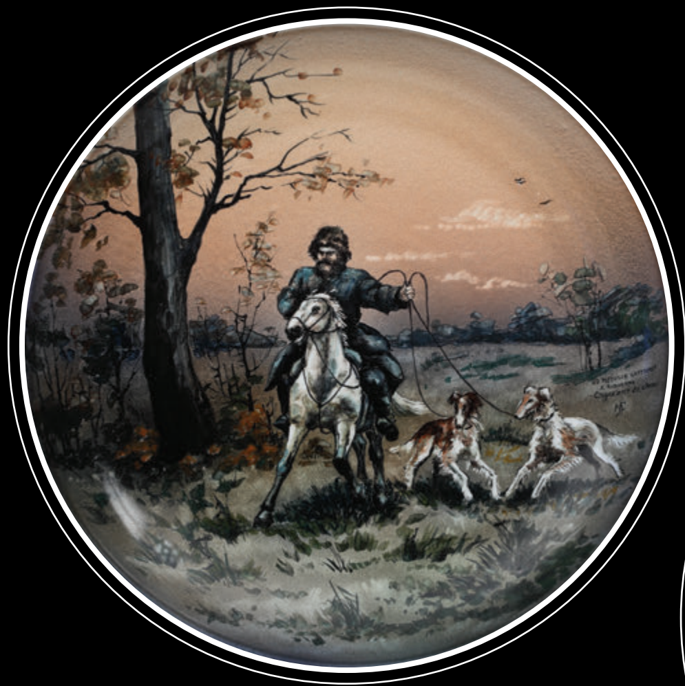
ПК «Завод «Псковский гончар» (город Псков)